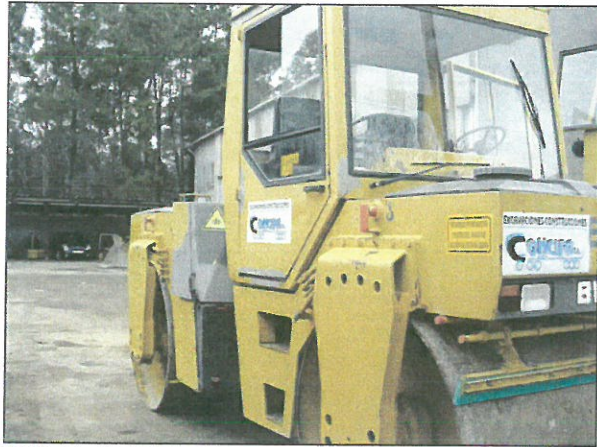
VISTA GENERAL DE LA MÁQUINA